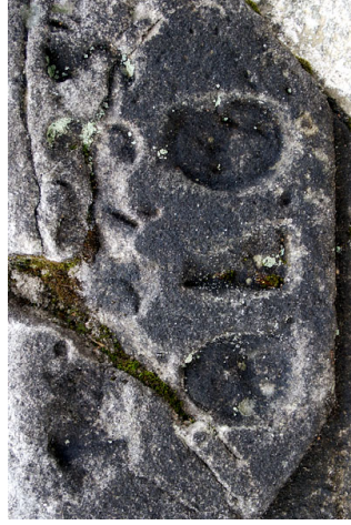
Obr. 6 — Zeměpisná délka s nerozluštěnou zkratkou.

Hodiny byly původně v mezikruží po obvodu číselníku označené římskými číslicemi pro sudé a značkami pro liché hodiny. Na plochu tohoto číselníku dopadají stín ukazatele pouze v období od března do září. Po zbývající část roku se Slunce pohybuje příliš nízkou nad obzorem na to, aby jeho paprsky mohly dopadnout na rovinu číselníku. Nad číselníkem jsou vyryta velká písmena MEZ znamenající německou zkratku pro středoevropský čas — Mitteleuropäisches Zeit. Pod těmito písmeny byl vyryt údaj o místní odchylce od středoevropského času, která činí -1 min 22 s, avšak dnes je téměř nečitelný. Význam písmen ÖL6 nebo spíše ÖLG, které jsou pod číselníkem se mi nepodařilo upřesnit, zato souřadnice 14° 39' 35" uvedena nad nimi označuje zdejší zeměpisnou délku (obr. 6).