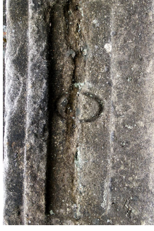
Obr. 8 — Značka pro východ.