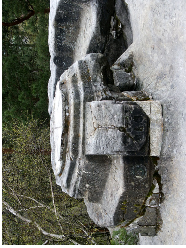
Obr. 4 — Kamenný stůl s lavicí a slunečními hodinami (ev. č. CL 1/3).

Praha 4, Pod Krčským lesem 25, Gymnázium Nový Porg (04 10) — jak je vidět na výsledku, autor si se zadáním slunečních hodin na stěně s azimutem -114^\circ poradil opravdu originálně. Hodiny jsou výjimečně hlavně svým nekonvenčním provedením. Tvar šikmé osmičky, nazývaný analema,