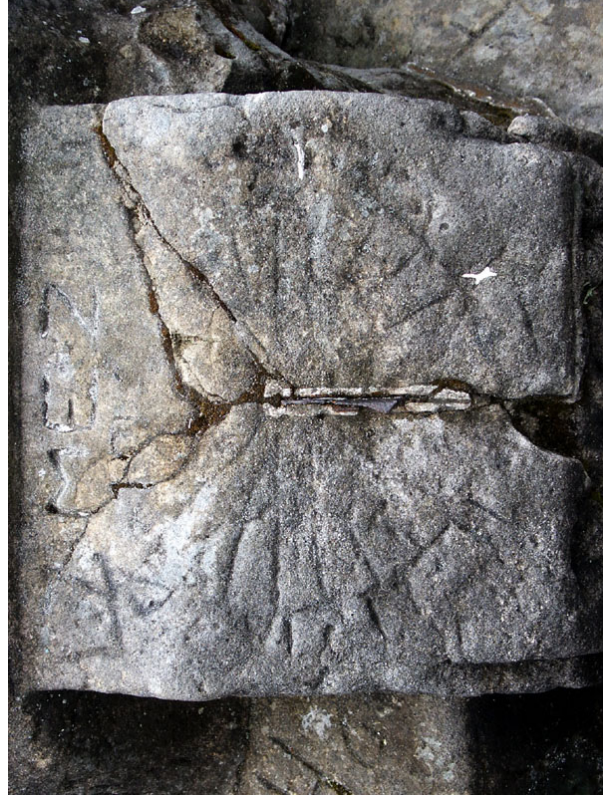
Obr. 5 — Rovníkové sluneční hodiny.