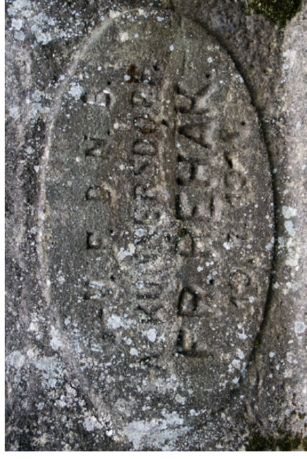
Obr. 9 — Texty v oválu vztahující se ke kumratické sekci Horskému spolku pro nejsevernější Čechy.