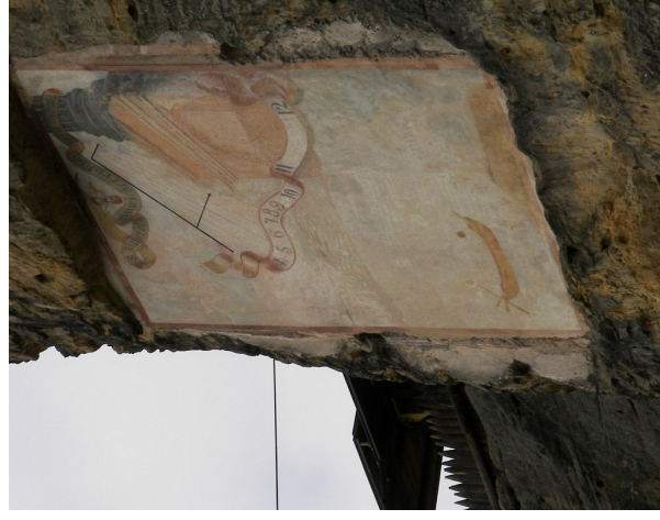
Obr. 1 — Sluneční hodiny ve Sloupu (CL 15).

Ze Zákup jsme jeli přes Svojkov do Sloupu v Čechách. Kromě prohlídky a fotografování slunečních hodin na hradě jsme zde dostali na výběr: buď prohlídku skalního hradu, nebo výstup na vyhlídku. Další hodiny ve Sloupu jsme ponechali bez povšimnutí, neboť se jednalo pouze o tyčku na kostele.