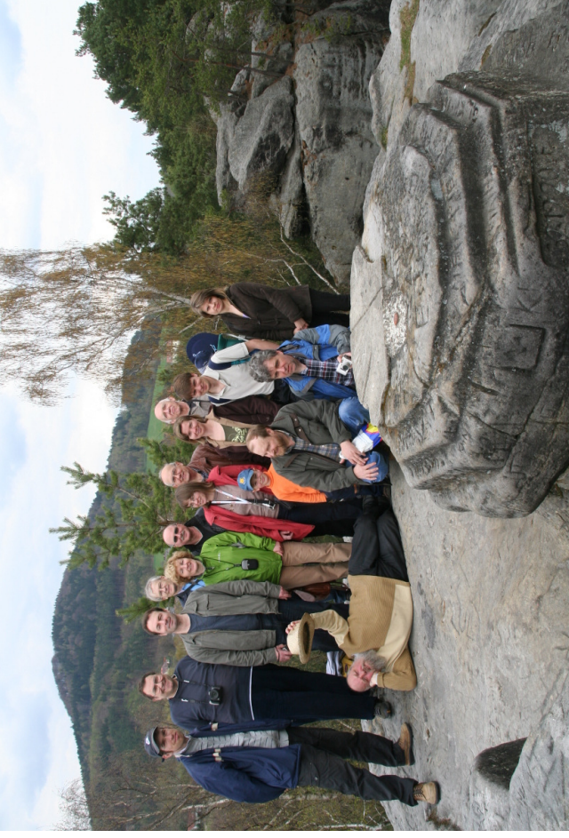
Obr. 3 — Skupinové foto na Dutém kameni.

Jelikož nám dvoje hodiny obsadily druhé místo, vejdou se sem ještě jedny hodiny s 11 body. Za slunečními hodinami DE BA 81 bychom se museli vydat do bavorského Kulmbachu, na hrad Plassenburg. Číselník o velikosti 4 \times 4 m je bohatě vymalován na stěně s azimutem 10^\circ . Již z dálky na nás zapůsobí svým pěkným grafickým provedením a na první pohled dojmeme bohatě gnómonicky vybaveného číselníku. Na stuze, táhnoucí se pod sluníčkem, je vyznačen postupně rok vzniku „Ano 1562“, arabské číslice hodin od 8 do 6 zapsané poloorlojním způsobem a datum renovací „ren 1882 1904“. Rovněž po obvodu rámu jsou vyznačené hodiny, tentokrát římskými číslicemi. Podle svislého směru hodinové rýsky pro 12. hodinu lze usuzovat, že hodiny ukazují pravý sluneční čas. Jelikož je použito jako ukazatele stínu šikmého ukazatele s nohem, lze předpokládat, že soustava křivek v ploše číselníku by měla být datovými čarami. Z jejich tvaru a rozmístění lze ale usuzovat, že byly chyběně překreslené při některé z restaurací. Další vadou na kráse je zde pokřivený ukazatel.