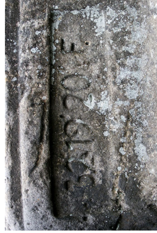
Obr. 7 — Zeměpisná délka měřená od Ferra na Kanárských ostrovech.

V další fázi našeho průzkumu se zabýváme luštěním nápisů, kterými je stůl pokryt po svém obvodu. Trochu záhadou je souřadnice 32° 19' 20" E vyrytá na JV straně (obr. 7). Jak se mi podařilo později zjistit, jde o zeměpisnou délku měřenou od Ferra na Kanárských ostrovech. Další nalezený údaj 50° 46' 13" na západní straně značí zřejmě zeměpisnou šířku. Výraznou značkou je zde písmeno O z německého „Ost“, označující východ (obr. 8).