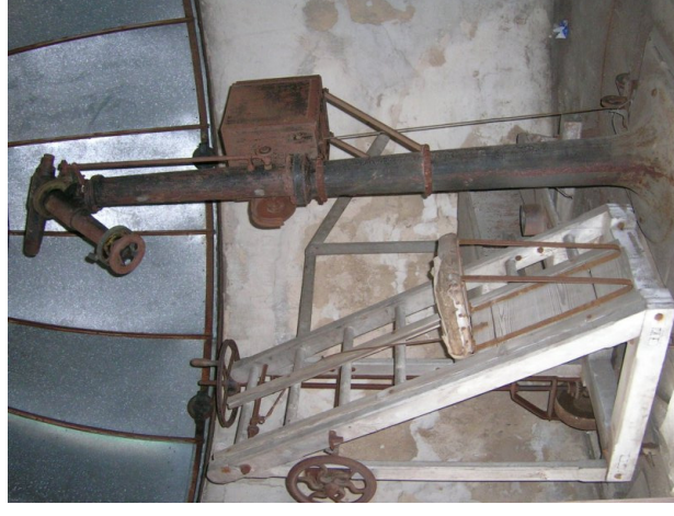
Obr. 11 — Paralaktická montáž.