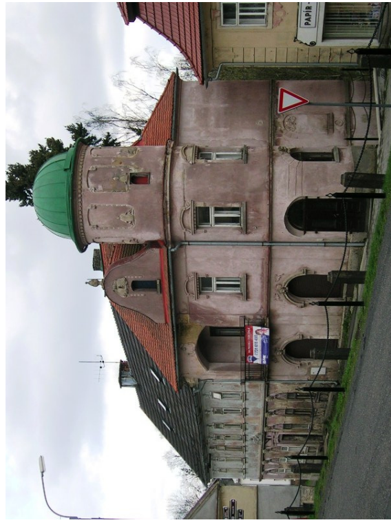
Obr. 10 — Budova bývalé lékárny v Mikulášovicích s kopulí hvězdárny.

Vydala: Astronomická společnost v Hradci Králové (2. 7. 2011 na 245. setkání ASHK) ve spolupráci s Hvězdárnou a planetáři v Hradci Králové vydání 1., 16 stran, náklad 100 ks; dvouměsíčník, MK ČR E 13366, ISSN 1213-659X Redakce: Miroslav Brož, Martin Cholasta, Josef Kujal, Martin Lehký a Miroslav Ouhrabka Předplatné tištěné verze: vyřizuje redakce, cena 35,- Kč za číslo (včetně poštovného) Adresa: ASHK, Národních mučedníků 256, Hradec Králové 8, 500 08; IČO: 64810828 e-mail: ( ashk@ashk.cz ), web: ( http://www.ashk.cz )