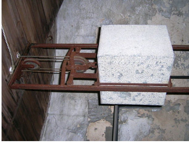
Obr. 12 — Hodinový stroj a závaží pod podlahou.