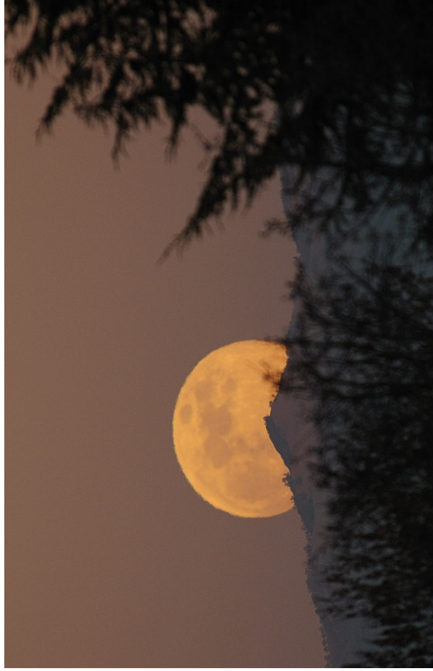
Obr. 21 — „Neobyčejně“ velký Měsíc na obzoru.