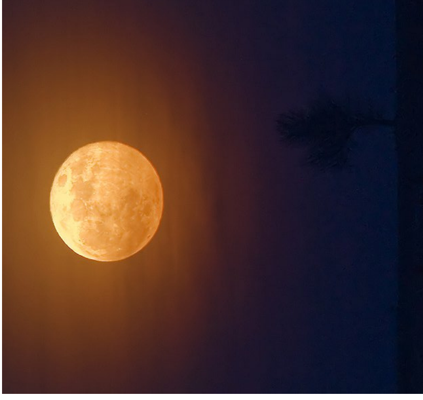
Obr. 19 — Krásný měsíční úplněk.

ským obzorem. Můžete se o tom kdykoliv přesvědčit jednoduchým pokusem — při východu Měsíce si smotejte papír či staré noviny do ruličky tak, aby zorné pole jejich průhledu zabíralo právě Měsíc. Noviny si zalepte a zhruba po třech hodinách se na Měsíc podívejte znovu — bude v průhledu stejně veliký, jako byl v době, kdy se nacházel jen nízko nad obzorem.