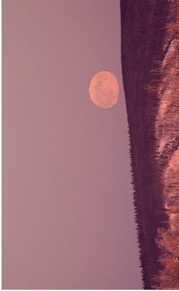
Obr. 20 — Zdeformovaný Měsíc při východu.