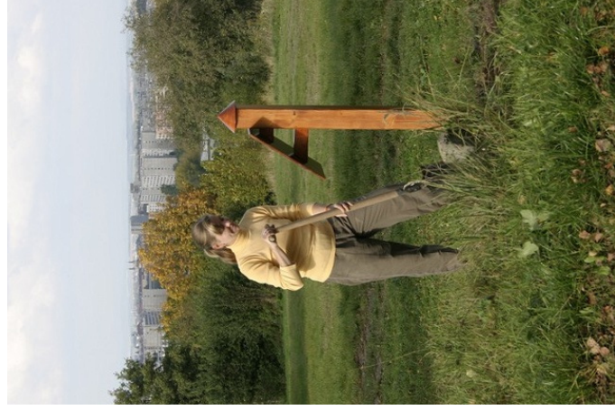
Obr. 18 — Kopáč najatý za mizivou mzdu.