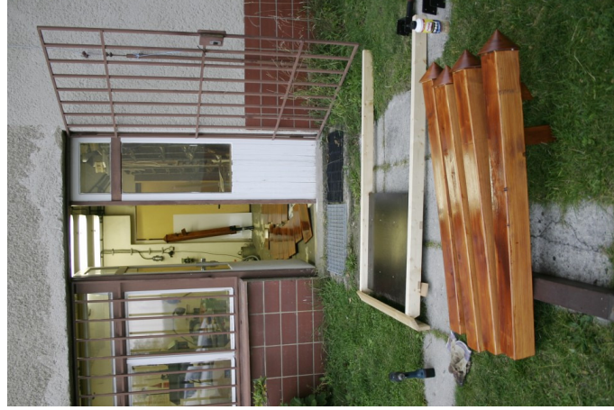
Obr. 17 — Přípravné práce v dílně hvězdárny.