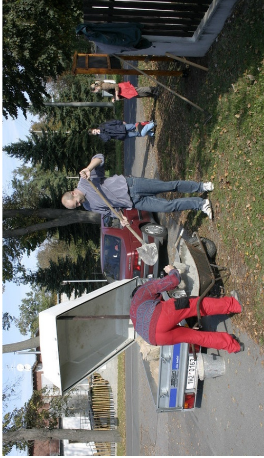
Obr. 16 — Betonování sloupků Galaktické stezky 7. 10. 2007.