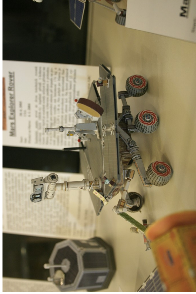
Obr. 25 — Mars Exploration Rover (autor modelu Ladislav Badalec). K článku na str. 5.