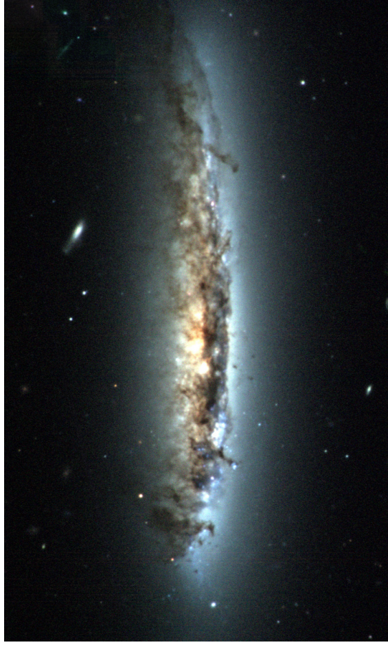
Obr. 16 — Galaxie NGC 4402 3,5 m dalekohledem na observatoři Kitt Peak. K článku na str. 9.

Předplatné tištěné verze: využívá redakce, cena 35,- Kč za číslo (včetně poštovného) Adresa: ASHK, Národních mučedníků 256, Hradec Králové 8, 500 08; IČO: 64810828 e-mail: ( ashk@ashk.cz ), web: ( http://www.astrohk.cz/ashk/ )