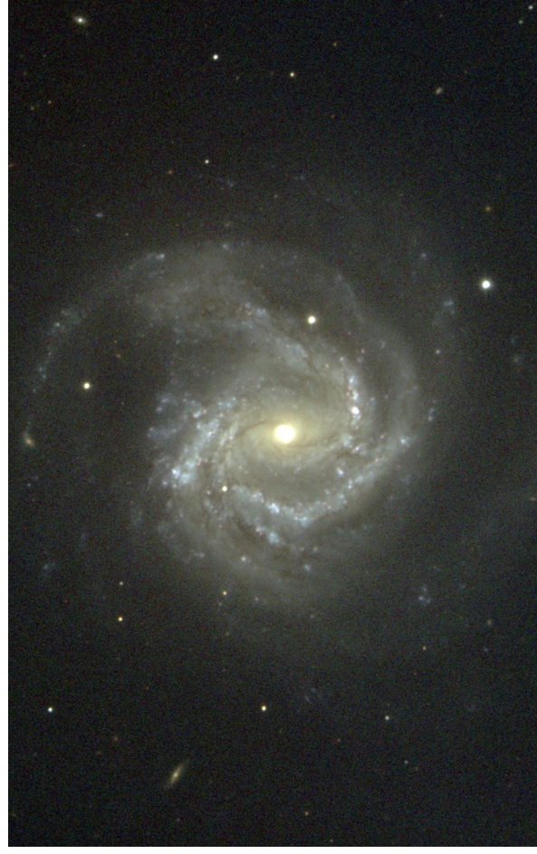
Obr. 17 — Galaxie M 61 snímaná 90 cm dalekohledem KPNO.