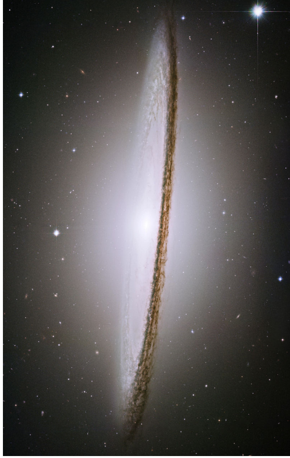
Obr. 18 — Galaxie M 104 Sombrero z HST. © NASA, STScI/AURA. K článku na str. 9.